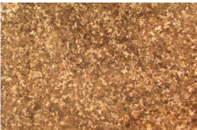
Homogenes, dichtes und feinkristallines Gefüge, kleine globulare Körner – gleichmäßige physikalische Eigenschaften

Beim Erstarren von Schmelzen aus Metallen oder Legierungen wird die Kristallisation in der Hauptsache von Kristallkeimen und dem Grad der Unterkühlung gesteuert. Der Grad der Unterkühlung ist eine prozessspezifische Größe. Mit zunehmender Unterkühlung erhöht sich die Zahl der Kristallkeime und damit auch die Kristallisationsgeschwindigkeit.