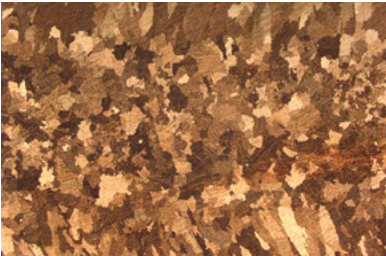
Heterogener Gefügebautbau, grobes globulares Korn mit groben Stengelkristalliten durchsetzt – ungleichmäßige physikalische Eigenschaften